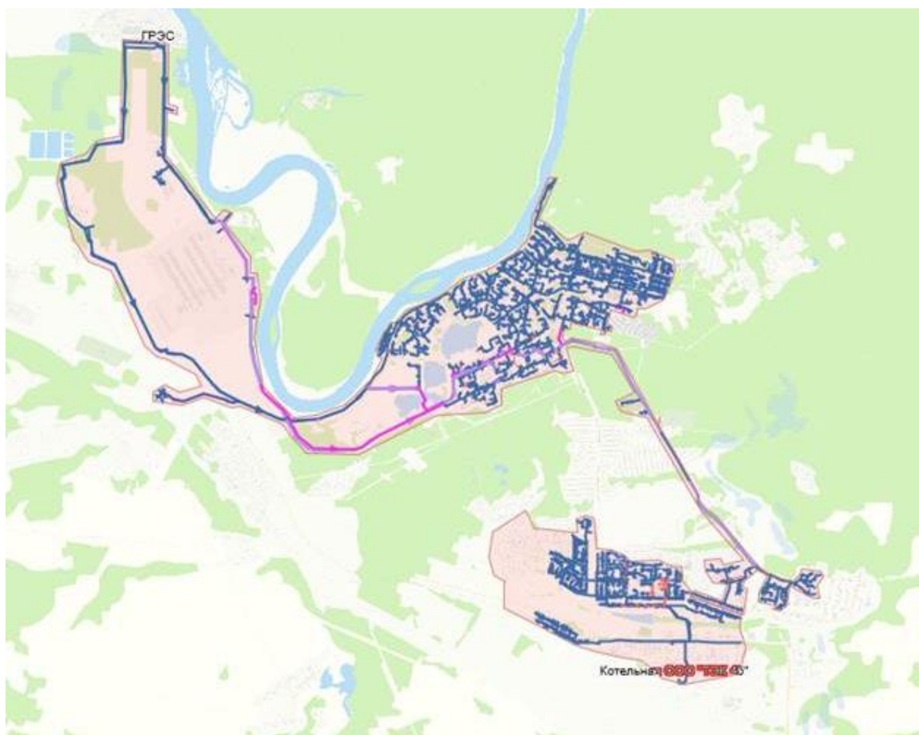
Рисунок 44. Зона деятельности единой теплоснабжающей организации МУП ТС

Зона деятельности единой теплоснабжающей организации приведена на рисунке 44.